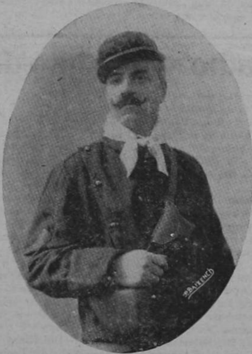
GIUSEPPE ARIE Ex-combatiente por la libertad de Grecia, muerto en Roma el 3 de Diciembre de 1933

Una de las más eficientes fuerzas de vida de un periódico y de su organización, está fuera de las oficinas diseminada por todos los rumbos del país, son los agentes corresponsales que sienten como todo el personal de redacción y administración, la misma congoja y la misma inquietud por el buen suceso y la marcha ascendente de la publicación a que están material y espiritualmente vinculados.